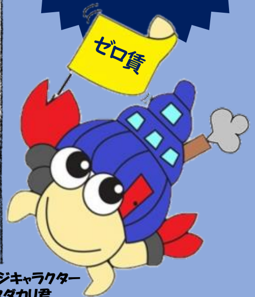
イメージキャラクター タダか!君